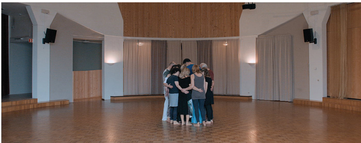
film still 'Nu verandert er langzaam iets'