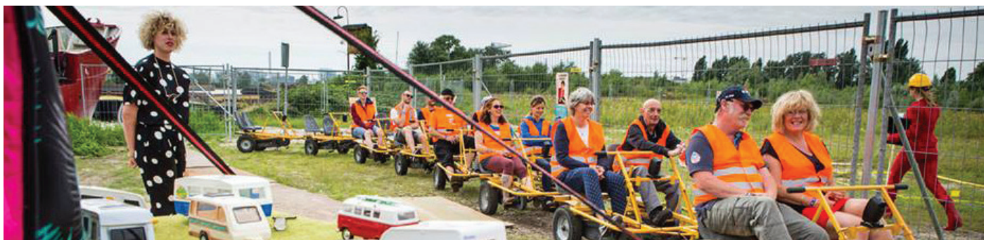
Scenefoto 'Kavelkamp Noord' Over het IJ Festival 2016