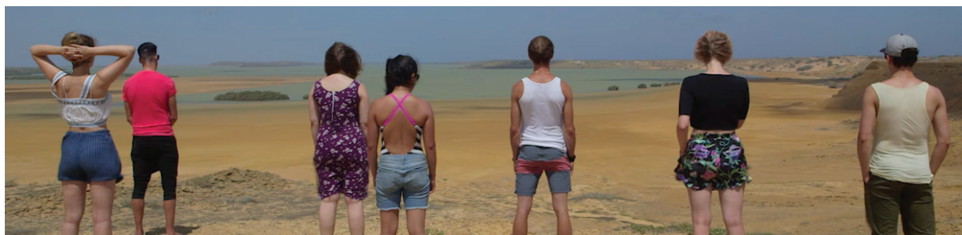
Film still research reis Colombia 2017

Kompagnie Kistemaker is de voortrekker van het magisch realisme als theatervorm. Het magisch realisme gaat uit van een gelaagd systeem van verschillende realiteiten dat bestaande en niet bestaande elementen combineert. Magisch realistische kunstenaars creëren geen nieuwe wereld, maar onthullen het magische in deze wereld. Binnen onze voorstellingen maken we gebruik van al deze elementen. Er is een transparante, groteske en waarachtige manier van spelen en het gebruik van verschillende theatrale middelen en speelstijlen mee gemoeid. Vragen die we daarbij stellen: hoe brengen we met onze voorstellingen meer magie in het rationele Nederland? Hoe verhouden we ons tot een maatschappij die steeds maakbaarder lijkt te (willen) zijn? En wie zijn wij als gezelschap, als mens, als cultuur? Wat verbindt ons met elkaar en de wereld, de maatschappij om ons heen? De voorstellingen van de Kompagnie zijn als een mozaïek. Naar het einde toe krijgen alle lagen en personages betekenis.